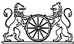
Slesvigske Køre Selskab

Eksamination, forspændt: "Cool Down" området efter Etape B i maraton. Det er kusken selv, der skal præsentere sine heste for dyrlægen efter et hvil på 10-15 min. Grooms må godt stå af vognen og gå ved siden af. En kusk, der ikke er kommet til cool down området og ikke fremviser sine heste vil blive udelukket. Bandager og gamasher må gerne tages af.